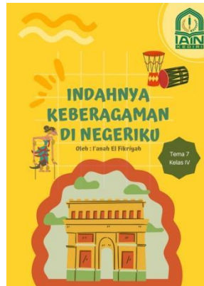
Gambar 2.2 Cover Mini Book

Mengembangkan materi mini book kearifan lokal Kediri (profil,suku bangsa,ragam agama, bahasa daerah, kesenian, wisata dan soal teka-teki) materi terkoneksi pada pembahasan KI & KD buku siswa