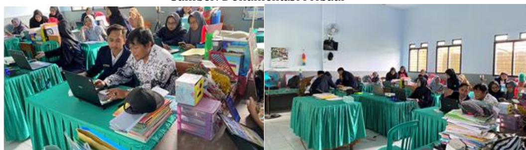
Gambar 3. Proses Pendampingan Guru oleh Mahasiswa PPG Prajabatan IPS UM dalam Pelatihan Canva di SDN 1 Banjarejo Malang

Dalam konteks sesi praktik yang dilakukan, para guru diberikan kebebasan untuk mengeksplorasi kreativitas mereka dalam pembuatan desain PowerPoint yang sesuai dengan ide dan mata pelajaran yang mereka ampu, menggunakan aplikasi Canva. Meskipun begitu, seperti yang sering terjadi dalam situasi yang melibatkan teknologi, beberapa kendala muncul. Salah satunya adalah sinyal wifi yang kurang stabil, yang berpotensi mengganggu kelancaran proses pengajaran dan pembelajaran. Kendala lainnya adalah kehabisan baterai pada perangkat laptop. Meskipun hal ini dapat menjadi hambatan, semangat para guru untuk tetap mengikuti pelatihan tidak berkurang. Mereka tetap termotivasi dan berusaha mengatasi setiap rintangan yang muncul. Tantangan lain terletak pada fakta bahwa masih banyak guru yang kurang terampil atau bahkan tidak familiar dengan alat-alat penting seperti cara menyisipkan video, musik, dan elemen multimedia lainnya menggunakan Canva. Meskipun mereka telah mengikuti pelatihan, tidak semua guru memiliki pemahaman yang sama tentang aplikasi ini atau alat desain grafis lainnya. Hal ini bisa disebabkan oleh berbagai faktor, termasuk tingkat keterampilan teknologi dan pengalaman sebelumnya.