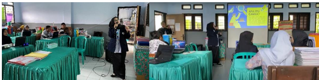
Gambar 2. Proses pemberian materi Canva kepada guru SDN 1 Banjarejo Malang