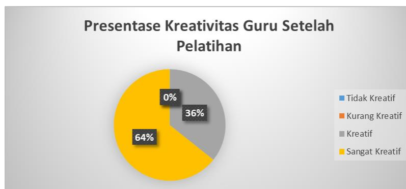
Gambar 5.. Presentase Hasil Kreativitas Guru SDN 1 Banjarejo Setelah Mengikuti Pelatihan Canva

Setelah mendapatkan pelatihan dan praktik langsung, pemahaman guru tentang Canva meningkat secara signifikan. Pada awalnya, terdapat 50% guru yang sangat paham, 36% paham, dan hanya 14% yang kurang paham. Namun, dengan adanya pelatihan yang terstruktur, terdapat peningkatan yang signifikan dalam pemahaman mereka, di mana 50% guru menjadi sangat paham, 36% menjadi paham, dan hanya 14% yang masih kurang paham. Penting untuk dicatat bahwa sebagian dari guru yang kurang paham sebelumnya adalah mereka yang sudah lama tidak mengoperasikan perangkat laptop dan kurang menguasai alat-alat di dalam Canva. Namun, para guru memberikan saran yang berharga, yaitu untuk menambah jadwal pelatihan agar pemahaman mengenai Canva lebih matang, serta untuk membuat buku modul yang menjelaskan fungsi-fungsi alat di dalam Canva, yang dapat digunakan sebagai pedoman saat ingin menerapkannya kembali agar tidak mudah lupa. Dengan demikian, dapat disimpulkan bahwa pelatihan Canva memberikan hasil yang positif dengan meningkatkan pemahaman dan kreativitas para guru dalam menggunakan aplikasi tersebut. Terus memberikan dukungan dan pelatihan lanjutan akan menjadi kunci dalam memastikan bahwa guru dapat memanfaatkan potensi penuh dari alat-alat digital seperti Canva untuk meningkatkan kualitas pembelajaran mereka.