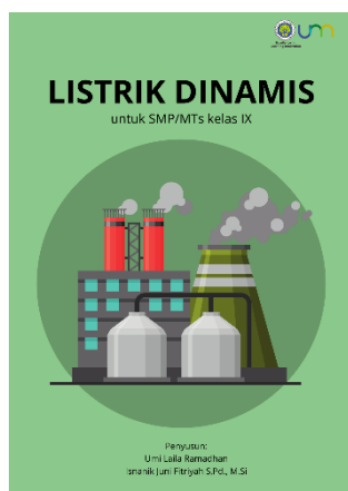
Gambar 2. Desain cover e-modul

Hasil pada tahap design adalah rancangan desain atau layout e-modul, rancangan materi, perangkat pembelajaran problem based learning , dan rancangan media yang digunakan dengan mengoptimalkan aspek 4C. Desain cover dan layout e-modul dibuat dengan menggunakan aplikasi Canva. E-modul interaktif Listrik dinamis ini di upload pada google drive pribadi peneliti kemudian di cetak barcode sehingga dapat di scan langsung oleh siswa. Komponen isi e-modul terdiri atas cover, kata pengantar, daftar isi, daftar gambar, daftar tabel, tentang modul, petunjuk penggunaan, deskripsi materi, peta konsep, bagian isi, uji kompetensi, glosarium, daftar pustaka, dan tentang penulis. Desain cover dapat dilihat pada gambar 2