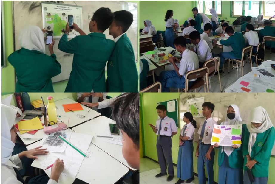
Gambar 3 DOKumentasi Kegiatan Pembelajaran

Metode ini memperluas kreativitas siswa dalam belajar sejarah lokal dan memperkuat keterampilan kolaboratif mereka dalam sebuah proyek kelompok.