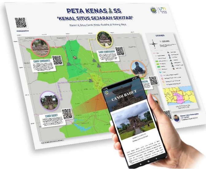
Gambar 2. Ilustrasi Penggunaan Peta

Pemilihan media peta dipilih dalam penelitian ini karena penggunaan media peta dianggap cocok dalam pengembangan media pembelajaran yang berusaha mengangkat keberadaan situ-situs sejarah sekitar, seperti 6 situs candi Hindu-Buddha di Malang Raya yang peneliti angkat dalam penelitian ini. Menurut Bolick (2006) penggunaan peta dalam pembelajaran sejarah tidak hanya memperkaya pemahaman siswa tentang peristiwa-peristiwa sejarah, tetapi juga membantu mereka mengembangkan keterampilan pemetaan, pemahaman spasial, dan pemecahan masalah secara visual. Dengan digunakannya media peta dapat mempermudah siswa dalam upaya memahami gambaran geografis keberadaan letak-letak dari 6 situs candi yang sedang dipelajari. Sehingga dalam proses pembelajarannya siswa tidak hanya sekedar memahami keberadaan situs candi secara tekstual namun juga memiliki bayangan terkait pemetaan lokasi dari tiap-tiap situs candi. Pengembangan media peta ini juga sebagai upaya pembuatan media yang mampu menyajikan materi 6 situs candi Hindu-Buddha di Malang Raya yang mudah diakses oleh siswa dalam satu media yang sama.