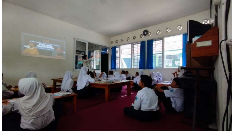
Gambar 3. Contoh berita cetak yang ditunjukkan

Selain itu, guru juga menyiapkan contoh dari berita cetak dengan membawa berbagai contoh koran, majalah, dan juga tabloid. Hal ini bertujuan agar peserta didik kembali menyegarkan ingatannya pada bentuk cetak dari berita yaitu koran. Peserta didik yang sudah terbiasa dengan gawai serta berbagai kecanggihan alat elektronik yang ada di sekitarnya, sering kali lupa bahkan kurang berminat dengan hal-hal yang dicetak seperti membaca berbagai hal yang disuguhkan secara cetak. Oleh karena itu, guru berusaha untuk memfasilitasi hal tersebut dan juga peserta didik yang memiliki gaya belajar visual.