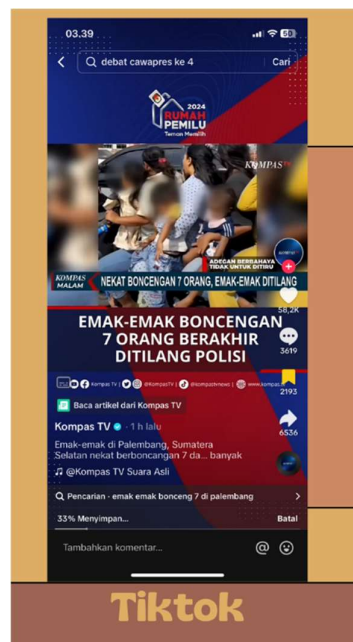
Gambar 2. Contoh berita daring yang ditayangkan

Pada contoh berita daring tersebut dipilih berita mengenai remaja yang ditangkap oleh pihak Kepolisian karena mengunggah foto dengan mengacungkan senjata tajam. Pemilihan berita ini memiliki tujuan agar peserta didik lebih berhati-hati lagi dalam bermain social media karena pada zaman sekarang peserta didik tidak dapat dipisahkan dengan kecanggihan teknologi informasi yang ada digengaman tangan mereka. Oleh karena itu, guru memilih berita tersebut sebagai bahan pengingat bagi peserta didik. Selain itu, guru juga memilih berita yang disajikan dengan media audio berupa video pendek yang diunggah di TikTok. Pemilihan platform social media TikTok bertujuan karena hal yang paling sering dilihat dan digemari peserta didik dari hasil asesmen diagnostik adalah TikTok. Oleh karena itu, guru memilih platform social media tersebut dengan berita yang membahas mengenai ibu-ibu yang berboncengan lebih dari dua orang. Hal ini sangat sesuai dengan kebiasaan peserta didik yang sering berboncengan lebih dari dua dan tidak menggunakan helm. Padahal hal tersebut dapat membahayakan keselamatan peserta didik.