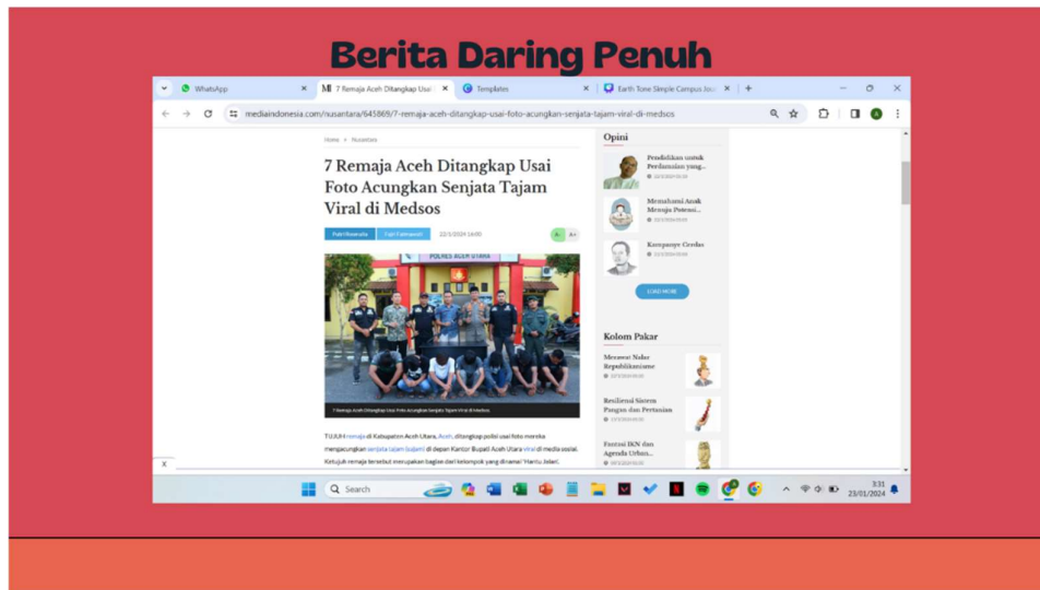
Gambar 1. Contoh berita daring yang ditayangkan