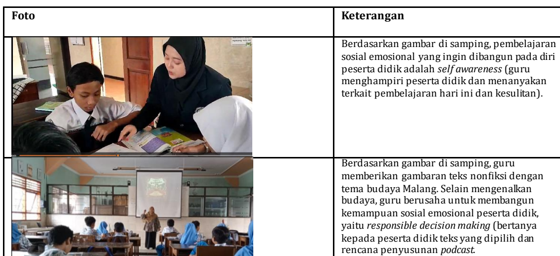
Tabel 1.3 Dokumentasi Implementasi Pembelajaran Sosial Emosional