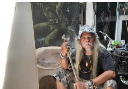
Gambar 3 Pencahayaan Model Chosaeri

Pemilihan model untuk dilukis sudah didapat proses selanjutnya yaitu mempersiapkan alat dan bahan untuk melukis meliputi kertas duplex, oil pastel, push pin, dan papan kayu, pembuatan karya lukis dilakukan siang hari tepat pukul 11.04 WIB di ruangan berkarya on the spot. Faktor pencahayaan sangat berpengaruh terhadap hasil karya lukisnya karena yang terpenting dalam berkarya realis secara on the spot ialah pencahayaan gelap terang, pada saat berkarya sempat terhenti sejenak tepat pukul 11.20 WIB karena pada pukul tersebut intensitas cahaya yang masuk ke dalam ruangan sangat terang sehingga sulit untuk menentukan gelap terang terhadap objek model Chosaeri. Disimpulkan dalam melukis tokoh model Chosaeri selesai dengan waktu 40 menit.