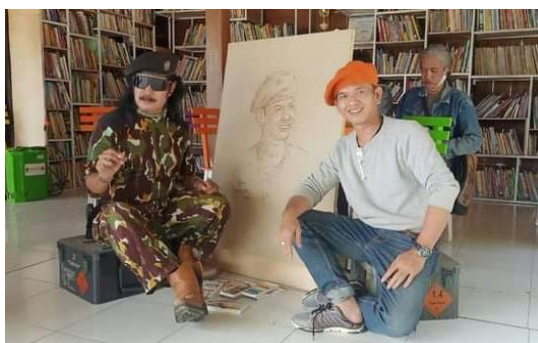
Gambar 20 Proses Finishing Lukisan Potret Rujiman

Alat dan bahan selalu terbawa ketika menghadiri sebuah acara, setelah alat dan bahan sudah tersedia dilanjutkan dengan menentukan pencahayaan model. Proses dilanjutkan dengan membuat sketsa model, dengan membuat goresan mencari detail objek model yang dituangkan ke dalam lukisan sebagai upaya mencari kebenaran bentuk pada bagian yang penting seperti mata, hidung, bibir, telinga, posisi, gestur, dan proporsi dilakukan dalam kesungguhan guna menampilkan watak dan karakter dari objek serta membuat keserasian antara objek aslinya dengan bidang lukisan. Sketsa yang mirip dengan model dilanjutkan dengan proses pewarnaan dan detail. Gelap dan terang menunjukkan cahaya seorang seniman menggunakan bayangan, untuk mempertegas bentuk digunakan kontras antara gelap dan terang.