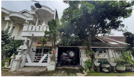
Gambar 1 Rumah & Galeri Jaya Adi

Gambar tersebut menampilkan rumah dan Jaya Adi Art Gallery, galeri berada di sebelah kanan dan di sebelah kiri yaitu rumah pribadi bersama keluarga. Ketika memasuki galeri akan melewati garasi mobil pribadi milik Jaya Adi kemudian disebuah ruangan tempat proses berkarya melukis model yang dilakukan secara on the spot terletak pada sisi kanan garasi mobil. Proses melukis yang berukuran besar juga dilakukan di ruangan tempat melukis secara on the spot karena dibanding dengan ruangan yang lain ruangan tersebut berukuran besar sehingga mempermudah untuk proses berkarya.