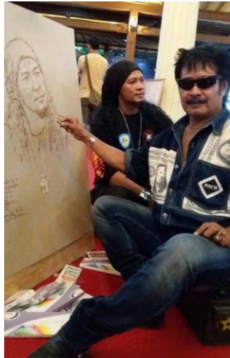
Gambar 14 Proses Detail Melukis Model Abimanyu

Tahapan finishing dengan cara mengamati model dengan lukisan yang sudah jadi dengan model aslinya, tujuan pengamatan untuk menemukan kekurangan objek lukisan dan juga melihat faktor kemiripan, jika menemukan kekurangan di dalam karya akan melakukan perbaikan dengan mempertegas garis arsir dengan cara linier, namun pada lukisan Potret Abimanyu tidak melakukan pengulangan karena pada proses detail dan pewarnaan karya lukis sudah mirip dengan model aslinya dengan proses pengamatan dari kejauhan membandingkan model dengan karya lukis. Lukisan sudah sesuai dengan model dilanjutkan membuat identitas yang berisikan nama populer, paraf, dan tahun pembuatan di bagian kiri bawah karya. Dapat disimpulkan dalam proses melukis tokoh model Abimanyu diselesaikan dengan waktu 15 menit.