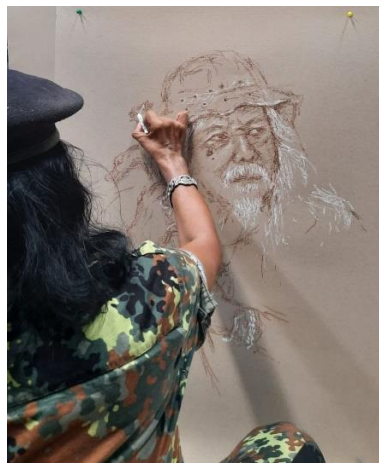
Gambar 5 Proses Detail & Pewarnaan Model Chosaeri

Proses sketsa yang terlihat mirip proses selanjutnya mendetail satu persatu bagian terutama bagian wajah model karena pada bagian wajah sangat menentukan bagaimana kemiripan dengan objek aslinya. Bagian wajah sudah terbentuk volume dilanjutkan ke arah objek pendukung lainnya seperti topi, tongkat, baju, cincin, dan gelang.