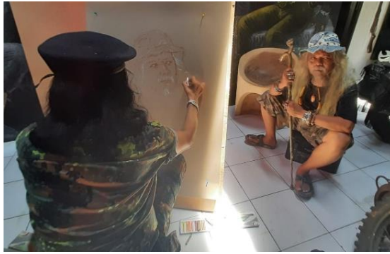
Gambar 4 Proses Sketsa Model Chosaeri

Proses sketsa yang terlihat mirip proses selanjutnya mendetail satu persatu bagian terutama bagian wajah model karena pada bagian wajah sangat menentukan bagaimana kemiripan dengan objek aslinya. Bagian wajah sudah terbentuk volume dilanjutkan ke arah objek pendukung lainnya seperti topi, tongkat, baju, cincin, dan gelang.