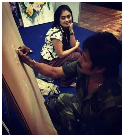
Gambar 10 Proses Detail Melukis Model Inanike Agusta

Cahaya mampu memunculkan kualitas permukaan benda-benda yang berbeda dan dapat menafsirkan sifat khas benda tersebut karena teksturnya yang terkena cahaya. Gelap dan terang menunjukkan cahaya seorang seniman menggunakan bayangan, untuk mempertegas bentuk digunakan kontras antara gelap dan terang. gelap dan terang bisa dicapai melalui paduan dari dua buah warna yang memiliki intensitas yang berbeda. Keadaan lukisan yang belum membentuk volume dilanjutkan proses pewarnaan dan detail untuk pembentukannya. Bentuk mata, hidung, bibir model karena pada bagian wajah sangat menentukan bagaimana kemiripan dengan objek aslinya sehingga perlu dilakukan proses detail dan pewarnaan.