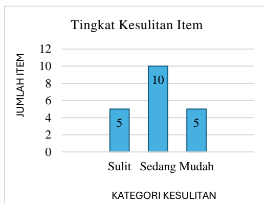
Gambar 2. Tingkat Kesulitan Item

logit dan 38,17 logit. Delapan siswa mampu menjawab item 19 tersebut dengan benar. Pada item 18 terdapat sembilan siswa yang mampu menjawab item dengan benar dan terdapat sepuluh siswa yang mampu menjawab item 20 dengan benar.