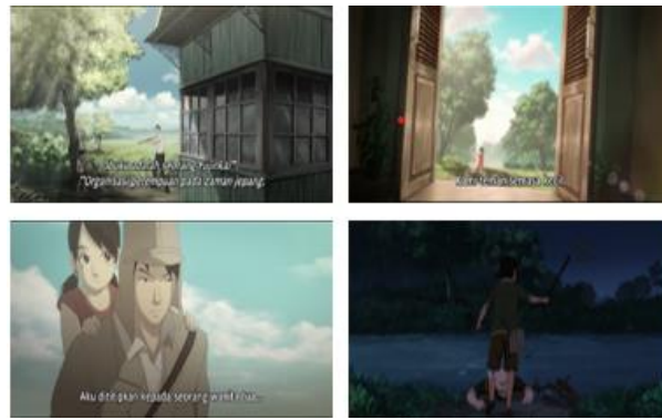
Gambar 3 Representasi nilai sila kedua Pancasila dalam film Battle of Surabaya