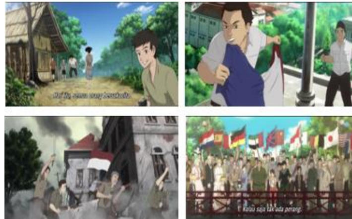
Gambar 5 Representasi nilai sila ketiga Pancasila dalam film Battle of Surabaya