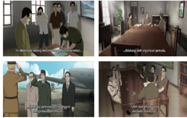
Gambar 7 Representasi nilai sila keempat Pancasila dalam film Battle of Surabaya