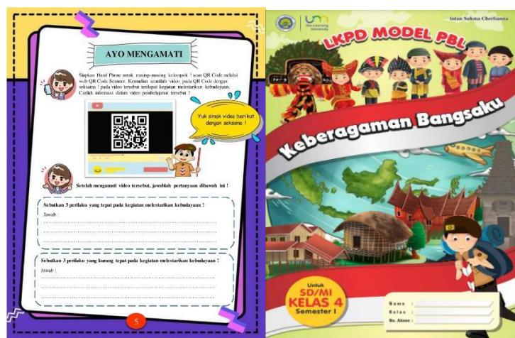
Gambar 2. Desain Cover dan Isi

Tahap pengembangan merupakan tahap penerjemah dari langkah-langkah yang sudah dilakukan pada tahap perancangan ke dalam bentuk fisik.