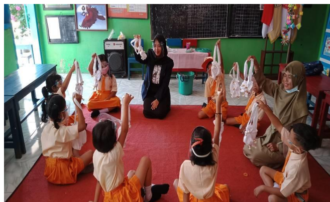
Gambar 4. Anak Menunjukkan Hasil Pembuatan Pola Batik Jumputan pada Siklus II

Penerapan kegiatan membatik jumputan pada gambar 3. Menunjukkan anak kelompok B TK Dharma Wanita Persatuan 1 Senggreng pada siklus I anak masih terlihat kurang percaya diri karena anak masih suka meniru karya temannya sehingga membuat anak lebih mencontoh temannya dari pada ide-ide yang dimiliki anak. Guru memberikan motivasi kepada anak untuk percaya diri terhadap hasil karyanya, anak harus bangga terhadap karya yang dihasilkannya.