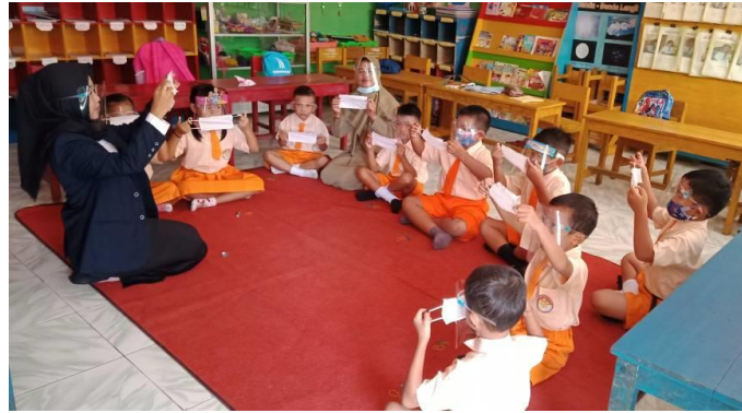
Gambar 3. Peneliti Menjelaskan Cara Membuat Batik Jumputan pada Siklus I

Penerapan kegiatan membatik jumputan pada gambar 3. Menunjukkan anak kelompok B TK Dharma Wanita Persatuan 1 Senggreng pada siklus I anak masih terlihat kurang percaya diri karena anak masih suka meniru karya temannya sehingga membuat anak lebih mencontoh temannya dari pada ide-ide yang dimiliki anak. Guru memberikan motivasi kepada anak untuk percaya diri terhadap hasil karyanya, anak harus bangga terhadap karya yang dihasilkannya.