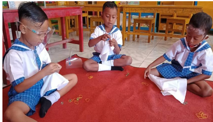
Gambar 6. Pembuatan Pola Mambatik Jumputan Siklus II oleh Anak

pola, bebas dan leluasa hal tersebut sejalan dengan pendapat Maulana & Mayar (2019) yang menyatakan bahwa anak akan menjadi kreatif ketika berkembang dan bertumbuh di lingkungan yang aman serta nyaman bagi anak. hal tersebut juga sesuai dengan pendapat Munandar (1997) bahwa lingkungan belajar yang melibatkan kreativitas anak akan menjadi tempat yang menarik dalam suatu pembelajaran, yang dimana dapat mendorong anak untuk bereksperimen dengan ide-ide yang dimiliki anak. Anak akan menjadi lebih aktif dan lebih percaya diri dalam proses belajar dan anak akan lebih menyukainya.