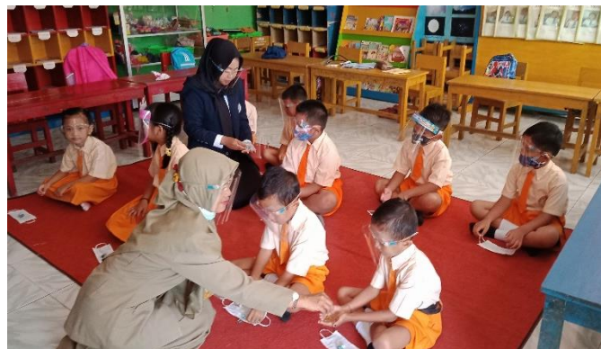
Gambar 5. Kegiatan Membatik Jumputan Siklus I

Sedangkan pada pertemuan kedua terdapat 11 anak dari 17 anak yang sudah terlihat tidak ragu dan mulai percaya diri dengan menuangkan ide kreativitasnya dan keterampilannya dalam membuat pola sudah mandiri dan tidak meniru temannya sehingga mendapatkan keterangan 7 anak BSH sedangkan 4 anak dengan keterangan BSB. Namun pada kegiatan membatik ini masih terdapat 6 anak yang mendapatkan keterangan MB, hal ini karena sebenarnya dalam menuangkan ide kreatifnya anak masih ragu dan kurang percaya diri dengan karyanya sehingga membuat anak masih melihat dan meniru temannya. Dari hasil kegiatan membatik jumputan ini dapat dikatakan Kemampuan seni rupa anak pada pertemuan kedua lebih meningkat dari pertemuan pertama.