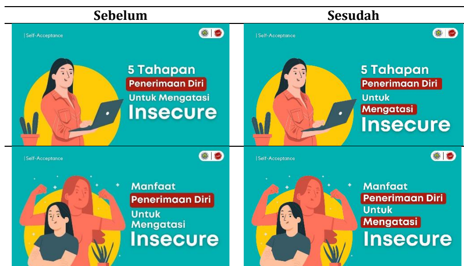
Tabel 2. Perbaikan Hasil Uji Calon Pengguna Konselor

Pelaksanaan uji calon pengguna (konselor) dilaksanakan oleh dua guru BK di SMP Negeri 6 Malang diantaranya Shinta Amelia, S.Pd. dan Aulia Kusumastuti, S.Psi. Dari hasil uji validasi calon pengguna didapatkan hasil kesepakatan dengan indeks 1,00. Hal ini menunjukkan bahwa media bimbingan konten video YouTube dan buku bimbingan mendapatkan kualifikasi sangat baik dan layak untuk digunakan. Revisi dari hasil uji calon pengguna yakni menambahkan highlight tulisan penerimaan diri pada thumbnail video. Berikut gambar produk sebelum dan sesudah direvisi pada tabel 2.