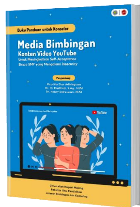
Gambar 2. Cover Buku Panduan

Hasil dari penelitian dan pengembangan ini yakni berupa media bimbingan konten video YouTube dan buku panduan penggunaannya. Konten video YouTube yang dikembangkan dapat diakses pada channel YouTube “Sahabat Konselor Official”. Tujuan pengembangan konten video YouTube ini yaitu untuk meningkatkan penerimaan diri ( self-acceptance ) siswa yang mengalami insecurity . Media bimbingan konten video YouTube ini diberikan sebagai layanan dasar sebagai upaya preventif. Siswa diberikan layanan bimbingan klasikal dengan media pembelajaran konten video YouTube. Desain pada pengembangan produk konten video YouTube menggunakan aplikasi InShot.com, CapCut.com, Canva.com, Background Eraser.com serta pengambilan gambar animasi menggunakan situs web Freepik.com. Untuk pengembangan buku panduan penggunaannya menggunakan aplikasi Canva.com, Background Eraser.com, dan juga Ms. Word untuk menata dan menggabungkan buku menjadi satu.