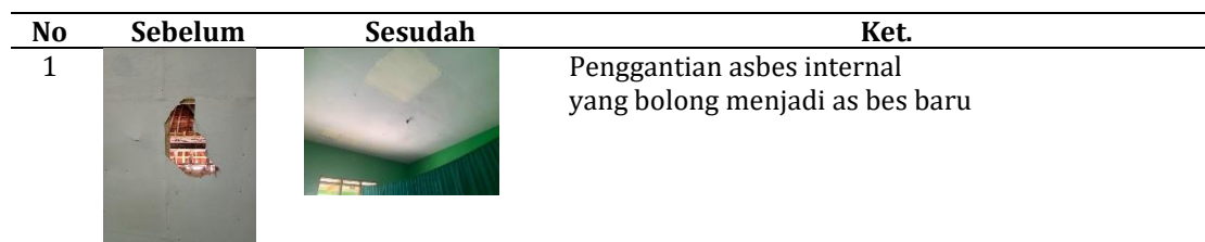
Tabel 2. Hasil Perbaikan Musholla

Berdasarkan rencana perbaikan musholla dan mengajar ngaji yang telah dilaksanakan, telah mendapatkan hasil yang dimana untuk perbaikan musholla telah disajikan pada Tabel 2 dibawah ini.