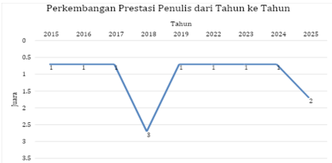
Gambar 3.1 Grafik Perkembangan Prestasi Penulis Dari Tahun ke Tahun

Autobiografi ini memberikan kontribusi penting bagi kajian ilmu keolahragaan dengan menyoroti pengalaman subjektif seorang atlet perempuan mahasiswa, sebuah area yang selama ini masih minim diteliti, khususnya di Indonesia. Penelitian ini menjawab research gap terkait studi autobiografi atlet gulat Indonesia dan fenomena dual career female athletes . Kebaruan penelitian terletak pada integrasi antara pendekatan autobiografis, sport science, dan analisis dual career, sehingga memungkinkan pemahaman holistik mengenai proses pembinaan prestasi. Dengan demikian, hasil penelitian ini tidak hanya memperkaya literatur akademik, tetapi juga memberikan wawasan praktis bagi pengembangan strategi pembinaan atlet perempuan dan pengelolaan dual career di lingkungan pendidikan tinggi dan olahraga prestasi.