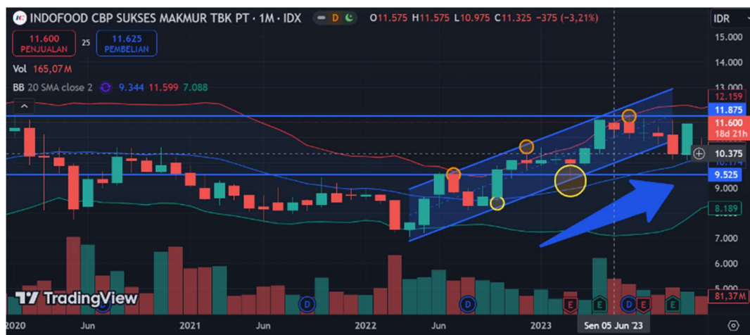
Gambar 1. Pergerakan harga saham ICBP secara bulanan dari Januari 2020 hingga Desember 2023.