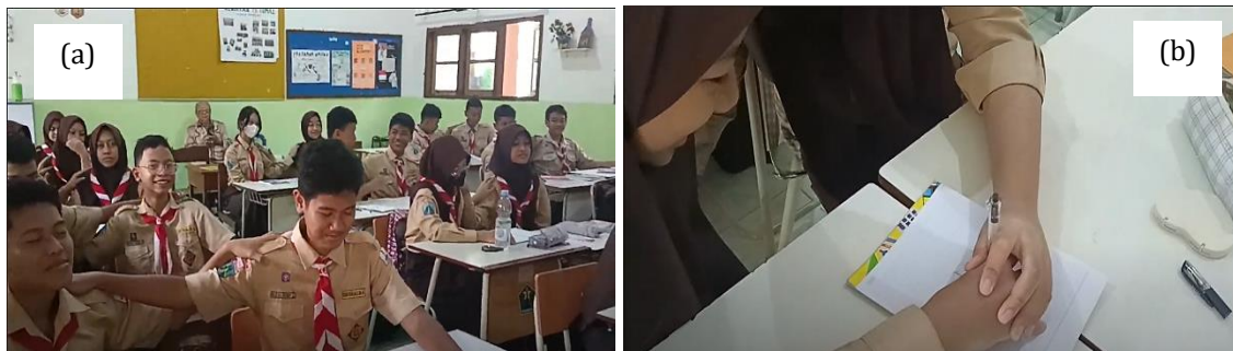
Gambar 4. (a) Peserta didik saling memegang pundak dan (b) Setiap kelompok menggambar hal yang telah dipikirkan sebelumnya

Dalam video tersebut, terlihat banyak peserta didik yang antusias untuk melakukan ice breaking tersebut. Ice breaking dimulai dengan mengatur tempat duduk peserta didik agar berkelompok sesuai dengan jenis kelaminnya. Setelah itu, masing-masing kelompok diminta untuk menyiapkan sebuah alat tulis dan kertas. Setelah menyiapkan sebuah alat tulis dan kertas tersebut, mereka diminta untuk saling memegang pundak dan memikirkan sebuah gambar. Penulis juga memberi kebebasan untuk memejamkan mata saat memikirkan suatu hal (Gambar 4a). Hal ini dilakukan agar mereka mampu mengoneksikan hati dan pikiran sehingga menemukan satu titik fokus terhadap hal yang nantinya akan digambar bersama. Setelah berpikir sampai batas waktu yang telah ditentukan, penulis meminta peserta didik untuk menggambar dengan menggunakan sebuah alat tulis dan kertas secara berpasangan.