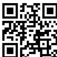
Gambar 3. QR Code video pembelajaran terintegrasi ice breaking

Implementasi ice breaking pada pembelajaran matematika dapat dipindai pada QR Code di bawah ini.