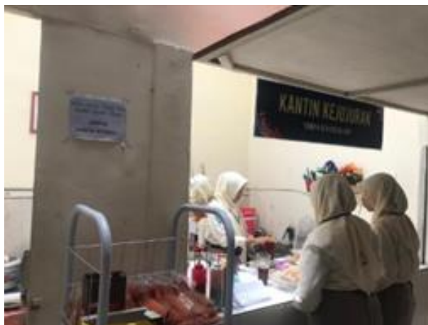
Gambar 3 Kantin Kejujuran

Rumah Kewirausahaan mempunyai banyak program kegiatan praktik terkait tranformasi nilai-nilai kewirausahaan pada peserta didik. Kegiatan yang dilakukan peserta didik saat tergabung dalam rumah kewirausahaan diantaranya ialah latihan rutin yang diadakan hari senin sepulang sekolah di ruang KWU SMK Negeri 2 Kota Kediri, kemudian praktik pembuatan produk dilaksanakan saat akhir pekan dengan mengurus izin dari Kepala Sekolah, selanjutnya ada perlombaan kewirausahaan tingkat daerah, dan yang terakhir ada kantin kejujuran. Pembina Rumah Kewirausahaan berkata bahwa paling tidak dapat mendidik anak terkait karakter kejujuran, tanggungjawab, kedisiplinan. Dan endingnya nanti jika lulus mereka bisa menjadi wirausaha (W/HK/I.2/08.02.2023).