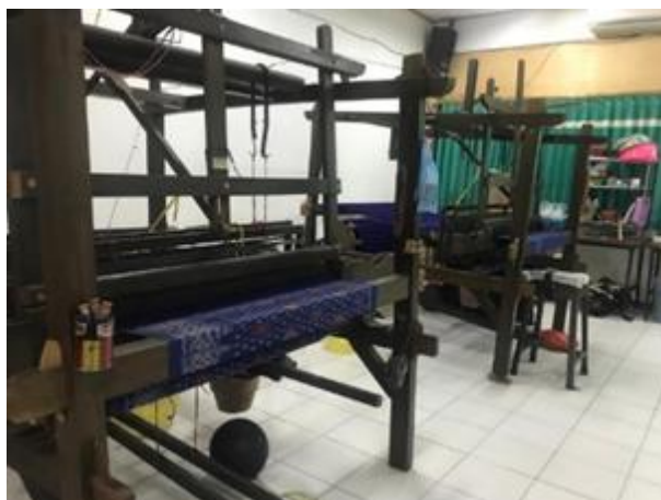
Gambar 5. Alat Tenun milik SMK Negeri 2 Kota Kediri

Program-program yang sempat terhenti disaat pandemi pada Rumah Kewirausahaan akan segera dioperasikan kembali seperti salah satunya pelatihan menenun, di Rumah Kewirausahaan SMK Negeri 2 Kota Kediri mempunyai 2 alat tenun yang sebelumnya digunakan untuk membuat tenun bandar khas Kediri. Hal ini juga merupakan salah satu prestasi dari sekolah dikarenakan hanya di SMK Negeri 2 Kota Kediri SMK yang mempunyai 2 alat tenun sekaligus walaupun tanpa jurusan Tata Busana.