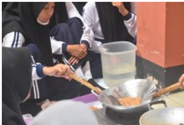
Gambar 2 Praktik pembuatan produk oleh Rumah Kewirausahaan

Rumah Kewirausahaan mempunyai banyak program kegiatan praktik terkait tranformasi nilai-nilai kewirausahaan pada peserta didik. Kegiatan yang dilakukan peserta didik saat tergabung dalam rumah kewirausahaan diantaranya ialah latihan rutin yang diadakan hari senin sepulang sekolah di ruang KWU SMK Negeri 2 Kota Kediri, kemudian praktik pembuatan produk dilaksanakan saat akhir pekan dengan mengurus izin dari Kepala Sekolah, selanjutnya ada perlombaan kewirausahaan tingkat daerah, dan yang terakhir ada kantin kejujuran. Pembina Rumah Kewirausahaan berkata bahwa paling tidak dapat mendidik anak terkait karakter kejujuran, tanggungjawab, kedisiplinan. Dan endingnya nanti jika lulus mereka bisa menjadi wirausaha (W/HK/I.2/08.02.2023).