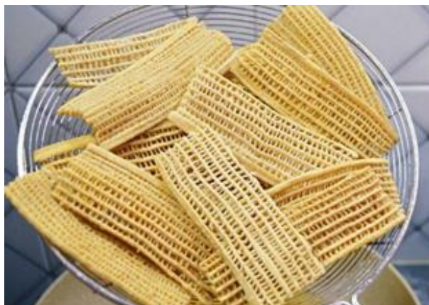
Gambar 4 Tarobok Produk Hasil Praktik R.KWU