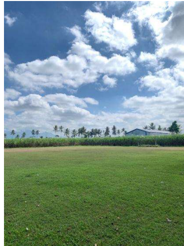
Gambar 1. Lokasi Lahan Tinjauan Rest Area