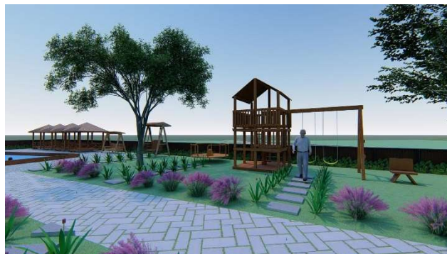
Gambar 6. Area Permainan Rest Area