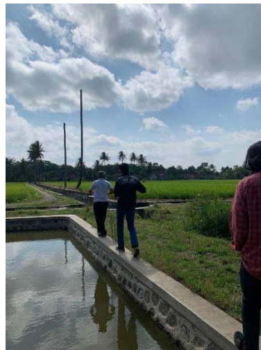
Gambar 3. Survey Lokasi Rest Area Desa Wonokerso

Implementasi desain pada kawasan rest area ini bertujuan untuk memanfaatkan potensi lahan terbuka yang tidak terpakai agar meningkatkan taraf ekonomi kehidupan masyarakat di Desa Wonokerso. Desain ini berlandaskan konsep Cultural-Tourism yang mana hasil desain dibuat menyesuaikan budaya masyarakat setempat.