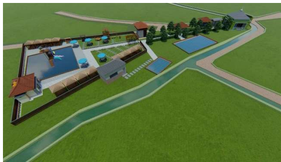
Gambar 5. Desain Tampak Samping Rest Area Desa Wonokerso