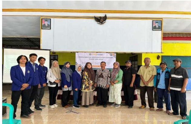
Gambar 7. Sosialisasi Desain Kawasan Rest Area Wonokerso

ini berdasarkan konsep cultural-tourism dan menggunakan teknologi website untuk sistem brandingnya (Gambar 7).