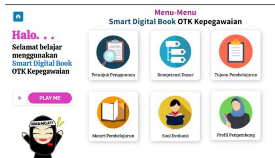
Gambar 2. Tampilan Home Page

Tahapan pertama yaitu pengguna menyiapkan laptop maupun gawai yang terhubung dengan internet, kemudian pengguna membuka link yang dibagikan untuk bisa mengakses multimedia interaktif berbasis Genially. Setelah mengklik link tersebut maka akan muncul tampilan awal seperti pada Gambar 1 dan tombol START untuk melanjutkan kebagian home page .