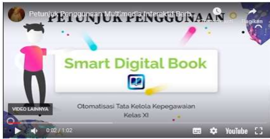
Gambar 3. Petunjuk Penggunaan