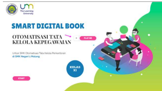
Gambar 1. Tampilan Awal

Penelitian ini menghasilkan produk berupa multimedia interaktif berbasis Genially pada KD 3.8 Menerapkan perencanaan karir pegawai 4.8 Menyusun perencanaan karir pegawai dan KD 3.9 Mengevaluasi penilaian kinerja pegawai 4.9 Melakukan rencana tindak lanjut pegawai pada mata pelajaran OTK Kepegawaian kelas XI OTKP di SMKN 1 Malang. Berikut adalah dari multimedia interaktif berbasis Genially: