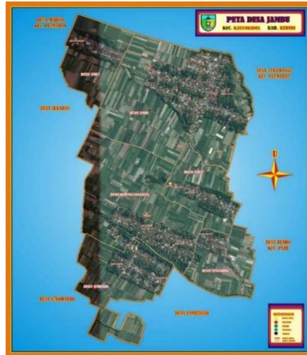
Gambar 1. Peta Wilayah Desa Jambu

Latar belakang pendidikan warga desa jambu cukup beragam, dengan mayoritas menyanggah lulusan SMP (1114 dari 3591 jiwa) disusul tingkat SMA (1102 dari 3591 jiwa) kemudian paling sedikit yaitu lulusan dari Strata II (10 dari 3591 jiwa) disusul Diploma-III (29 dari 3591 jiwa)