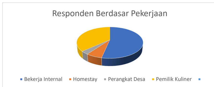
Gambar 2. Responden Berdasarkan Pekerjaan

Pada penyebaran angket ini disebar sebanyak 30 angket dan terisi 30 angket sebagai data primer penelitian ini. Profil responden berdasarkan jenis kelamin dapat dilihat pada Gambar 3 yaitu terdiri dari 10 Laki-laki (33,33%) dan 20 Perempuan (66,67%). Sementara berdasarkan latar belakang pekerjaan dapat dilihat pada Gambar 2 yaitu 13 orang bekerja di dalam Desa Wisata ( tour guide , pengrajin, pedagang di papringan), 3 orang pengelola Desa wisata, 1 orang perangkat desa, 11 orang pemilik tempat kuliner, dan 2 orang sebagai pemilik Homestay . Sementara untuk alamat pengisi di dominasi dapat dilihat dari Gambar 4 yaitu warga Dusun Jambu 15 orang, disusul Kedungcangkring 8 orang, Dusun Semut 4 orang, dan Suren, semanding, sumberjo masing-masing 1 orang.