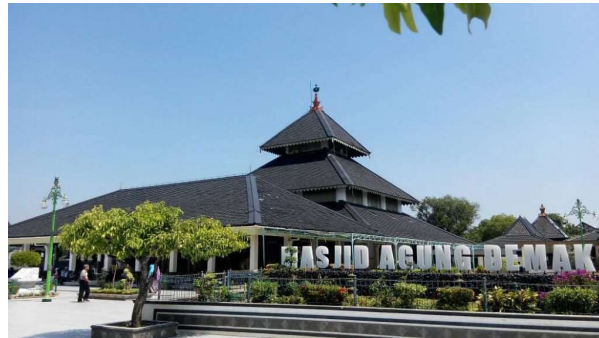
Gambar 2. Masjid Agung Demak yang Memiliki Atap Seperti Candi dan Kuil Hindu di Asia Selatan

Adapun menurut Aziz (2013) bentuk atap Masjid Agung Demak yang bertingkat (lihat gambar 2) memiliki kemiripan dengan kuil-kuil Hindu yang berada di Asia Selatan. Hal tersebut mengindikasikan bahwa Masjid Agung Demak adalah bangunan yang memiliki beragam ciri khas masyarakat yang tinggal di Demak dari etnis Cina, agama Islam, etnis Jawa, dan penganut agama Hindu.