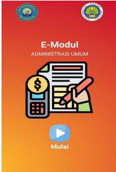
Gambar 1. Tampilan Awal E-modul