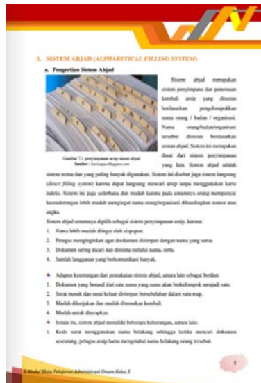
Gambar 5. Tampilan Materi dalam E-modul