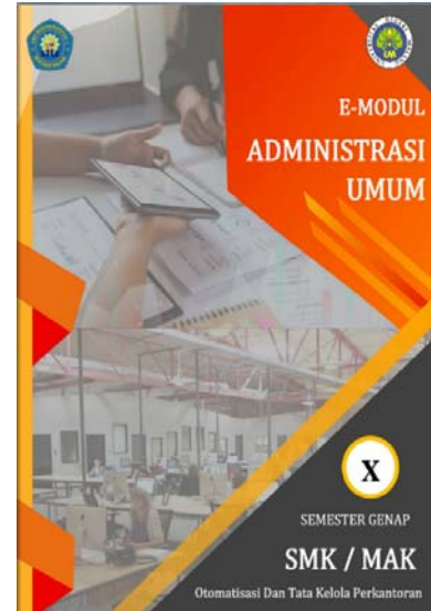
Gambar 3. Cover Depan E-modul

Berikut merupakan tampilan E-modul berbasis Android pada bagian inti yaitu pada bagian kegiatan pembelajaran yang disajikan secara menarik serta dilengkapi dengan video pembelajaran.