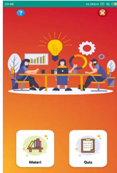
Gambar 2. Tampilan Menu E-modul