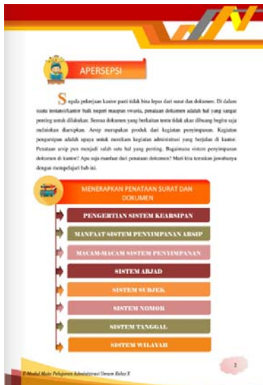
Gambar 4. Tampilan Apersepsi dan Peta Konsep Materi

Berikut merupakan tampilan E-modul berbasis Android pada bagian inti yaitu pada bagian kegiatan pembelajaran yang disajikan secara menarik serta dilengkapi dengan video pembelajaran.